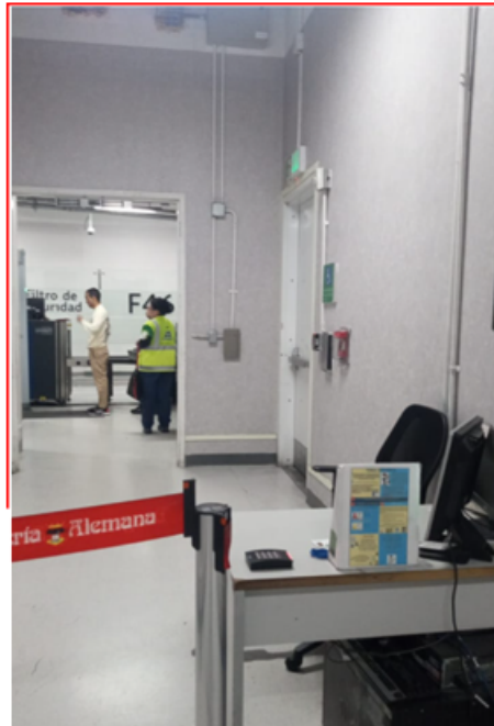
Figura 2: zona para ingreso de suministros.

Lamentamos los inconvenientes que estas obras puedan generar por lo que recomendamos tomar las medidas correspondientes para evitar la afectación en la operación.