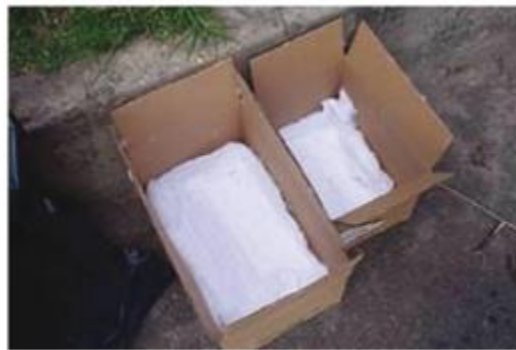
Fotografía 1 Ejemplo caja para transporte de avifauna

En caso de no poder llevar los huevos o polluelos rescatados de forma inmediata al lugar de reubicación, es necesario brindar condiciones de alimentación y pernoctación. Para esto, se puede preparar una mezcla de frutas, las cuales se deben picar en pequeños trozos. Entre las frutas recomendadas están: papaya, mango, banano y guayaba. También es importante mantener alpiste para alimentar a los polluelos juveniles. Otros alimentos que se pueden suministrar son lombrices de tierra y/o larvas de tenebrios como fuente de proteína.